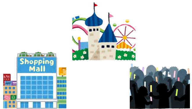
こんざつ 混雑する い ところにはなるべく い 行かない