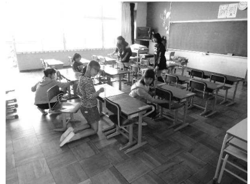
1年生の教室の準備

6年生は、かわいい1年生に頼られることで、人の役に立つことの素晴らしさや喜びを知ることができます。「自分が世の中の役に立っている」という自己有用感は、自分に自信をもって生き生きと生きていくために大切なものです。