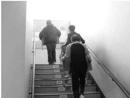
新学期に備え機の移動

特に6年生には最高学年としてやる気を感じました。6年生は先週末に新学期の準備に来てくれました。