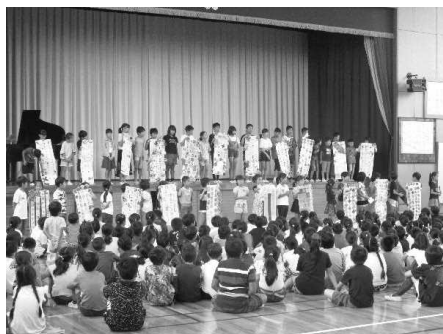
各学級の願いを発表