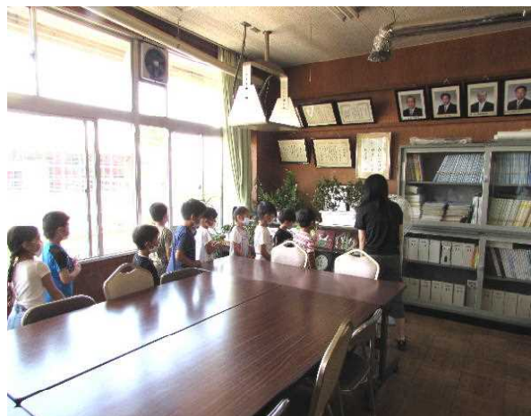
校長室の写真はだれ？

他にはどんな場所があるのでしょうか。6年間過ごす場所です。早く覚えてたのしい学校生活を過ごしてもらいたいです。