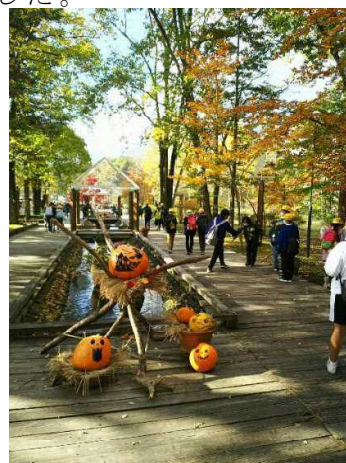
軽井沢タリアセン

午後は、軽井沢タリアセンで過ごしました。塩沢湖でボートに乗ったり、ゴーカートやアーチェリーを体験したり、そ