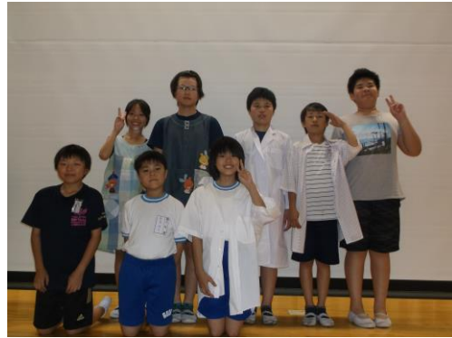
保健委員会 保健集会で発表の様子