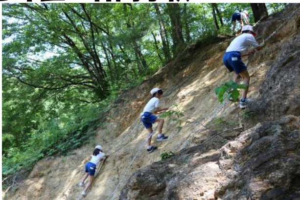
なんだ坂、こんな坂 鎖を頼りに登ります

6月8日から1泊2日で5年生の林間学校が実施されました。前日の雨が嘘のように晴天に恵まれ、チャレンジハイク、キャンプファイヤー等予定通りやり遂げることができました。