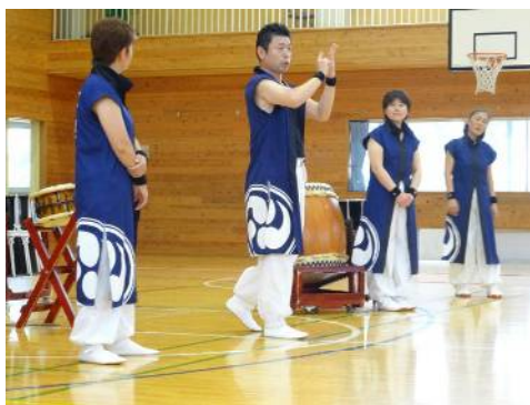
演奏の合間には手話も教えていただきました。

6月5日(火) 上州ろう太鼓「心響」の方々による和太鼓の公演がありました。「心響」は耳が聞こえない方々が多く所属するグループです。仲間同士のアイコンタクトや、伝わる振動を感じて太鼓を打つタイミングをとっているそうです。迫力ある一糸乱れぬパフォーマンス、子ども達も圧倒されていました。