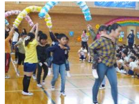
6年生のおんぶで入場

宝東小の児童は、集会での態度が立派です。おしゃべりはなく、あいさつができ、歌が美しく上手に歌えます。代表委員会の児童も立派に仕事を果たします。これからも宝東小の自慢のひとつとして、集会に取り組んでいきましょう。迎える会での話の一部を紹介します。