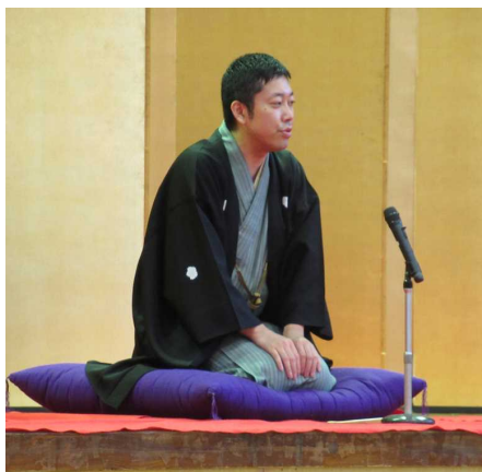
ばきゆう 馬久さんの落語