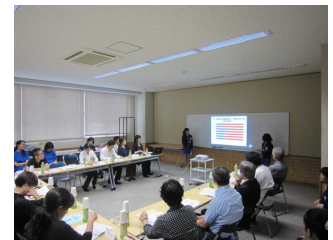
発表する保健委員

今回は、学校の健康課題として、「生活習慣病」を取り上げ、4~6年の児童からとったアンケートの結果について、保健委員が発表をしました。この結果を受けて、学校医や薬剤師の先生方から、貴重なご助言等をいただきました。今後の本校の健康教育の推進に役立てていきたいと思っております。保健委員の皆さん、発表ありがとうございました。