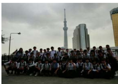
2年B組（東京スカイツリー）