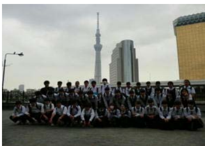
2年A組（東京スカイツリー）