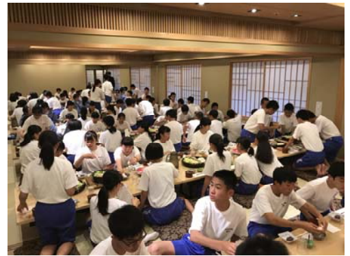
2日日夜すき焼きを食べる様子

事前の準備やお子さんの学校までの送迎など保護者の皆様、たいへんありがとうございました。