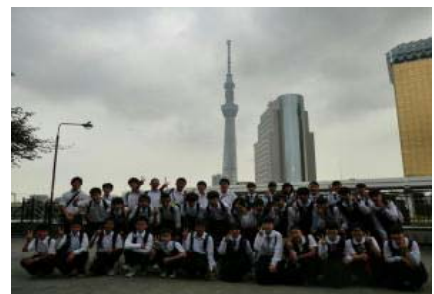
2年C組（東京スカイツリー）