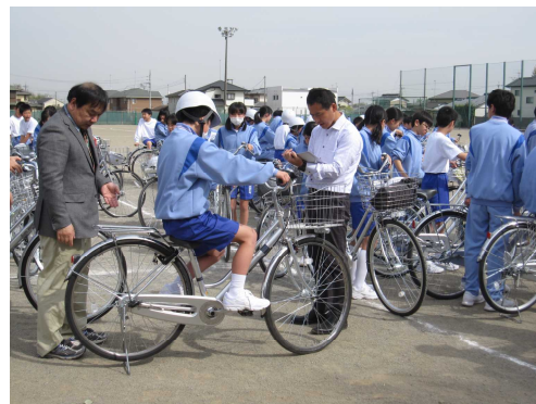
自転車点検の様子

点検で不備等指摘があった場合には、至急整備をお願いします。タイヤの空気圧の調整も含め、交通事故の未然防止のために今後ともご家庭で継続して点検をお願いします。