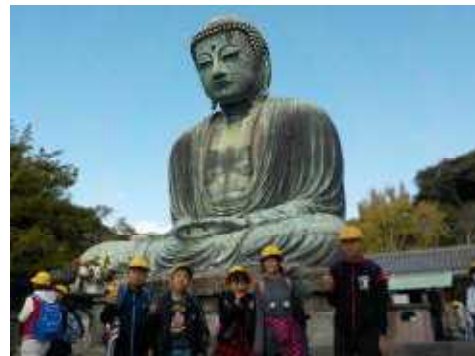
修学旅行 11/12-13 〈6年〉