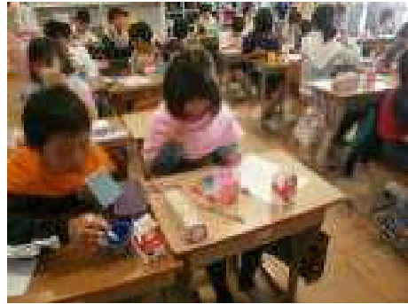
ブラッシング指導 10/7 〈4年〉