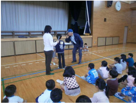
防犯教室 10/5 〈1・4年〉