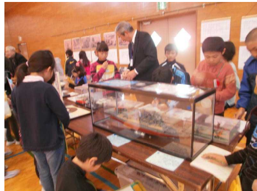
戦争を語り継ぐ会 12/17