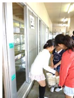
かたづけのようす