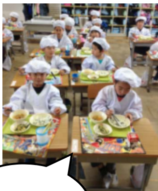
1年生も給食がはじまりました!