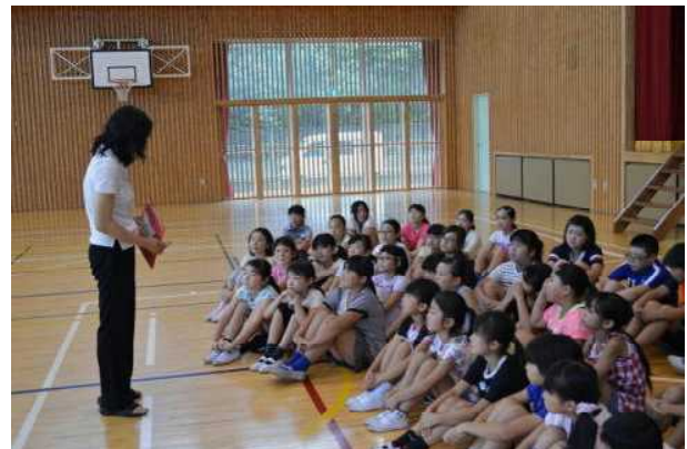
[音楽集会(NCG Niragawa Chorus Group)の皆さんの合唱です)]