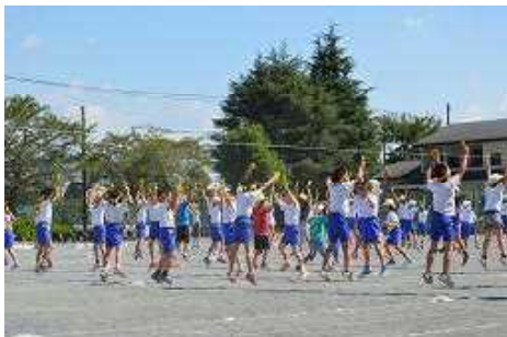
3・4年ダンス「ええじゃないか」気持ちを一つに踊ります