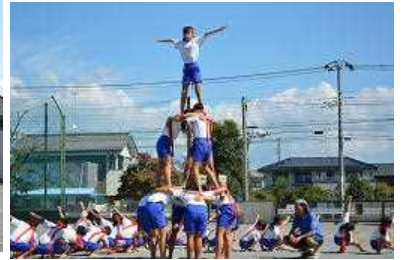
5・6年「韮っ子ソーラン節」