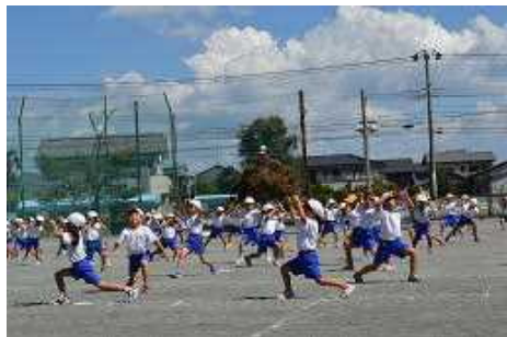
1・2年ダンス「あいうえ音楽」かわいさいっぱい