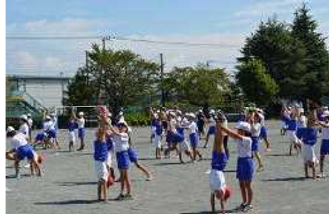
5・6年 組み立て表現 その後「葦っ子ソーラン節」