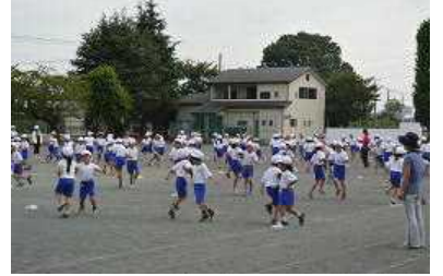
3・4年「ええじゃないか」1・2年ダンス「あいうえ音楽」

子ども達の練習する姿を参観して 9月最初の頃に比べると、大変上達しています。 先生方の熱の入れようもすごい！きっと、明日の 運動会では、子ども達が素晴らしい姿を見せてく れると思います。是非、ご声援のほどよろしくお 願いします。