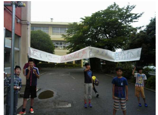
代表委員によるあいさつ運動の様子

6月9日からの1週間、7:45から、代表委員会による「あいさつ運動強化週間」を実施しました。「あいさつ 大きな声 相手を見て 自分から」の横断幕を作り、登校する子ども達に進んであいさつすることの大切さを伝えてくれました。代表委員会の皆さんは、責任をもってよく頑張ってくれました。