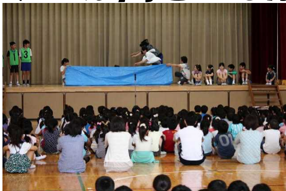
体育委員のプールの安全な使い方の説明

梅雨を迎えた時期ですが、同時に夏本番も間近です。5日には、本校のプール開きを行いました。体を鍛え、体力をつけるのにとってもよい水泳指導の始まりです。5、6年生がプールの清掃を行いました。よく頑張ってくれたおかげでとてもきれいなプールになりました。私からは、一番大切なことは安全であることと、目標を決めて頑張りたいと話しました。体育委員の皆さんも、プールの安全な使い方についてとても分かりやすく説明してくれました。卒業するまでに、子ども達が25メートル以上泳げるようになることを期待しています。