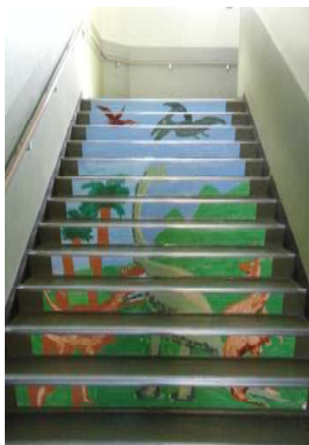
↑ 恐竜がいっぱい 吠える声が聞こえてきそうです

昨年の図工クラブの児童の皆さんが描いた「階段絵」が完成したので春休み中に設置しました。