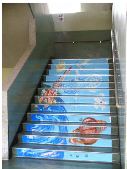
↑ 大胆な構図で描かれた宇宙の絵