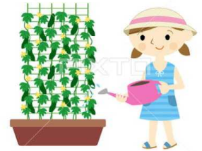
pixta.jp - 11074295

三つ目は、7月31日に「太田市の水泳記録会」があり、太田小学校から19名が参加しました。校長先生は19名の一人一人が一生懸命頑張って泳いでいる姿を観ていて、とても嬉しかったです。何でも、「一生懸命頑張る」ことは、自分を高めることに繋がることだと思います。