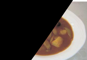
ブラウンシチュー

太田市特産のまこもだけをふんだんに使っ たおみそ汁です。稲科のマコモという植物の 根本が大きくなってできたものです。タケノコ のようなシャキシャキした食感でほんのりあ まみがあり、とてもおいしいですよ。