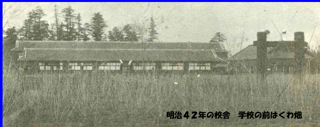
明治42年の校舎 学校の前はくわ畑