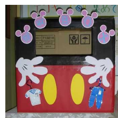
回収ボックス A棟2階

ご家庭に使わなくなった綿小の体操着がありましたら学校にお届けください。近所の児童を通じてでも結構です。特に高学年用の需要が高いです。