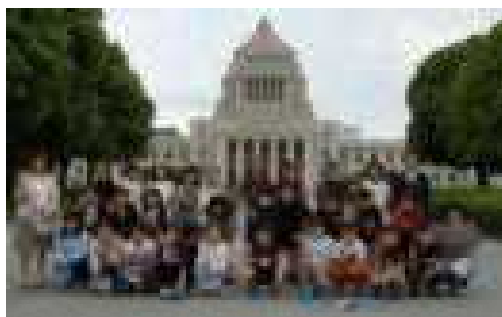
6年1組 国会議事堂前にて