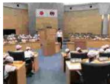
太田市役所 市議会議場

社会科で、市の特色ある地形や土地利用の様子、主な公共施設の場所と働き、交通の様子、古くから残る建造物などについて調べています。教科書や資料で調べたり実際に見学したりして、地域の様子は場所によって違いがあることを理解し、自分たちが日々暮らしているこの太田市に対して誇りや愛情をもつことをねらいとしています。