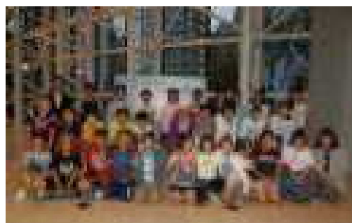
6年2組 ホテルのホールにて