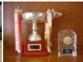
個人戦優勝杯 右は昨年度の団体戦優勝記念のレプリカ