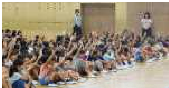
「夏休み中に自分から進んでお手伝いをしたよ」と手を挙げる児童

いよいよ2学期が始まり、子ども達の元気な声が学校に戻ってきました。どの子も生き生きとした表情に成長のあとが見られ、夏休み中、家庭や地域での様々な体験活動や人々との触れ合いをとおして、有意義に過ごした様子がうかがえます。