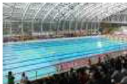
群馬県小学校水泳教室記録会